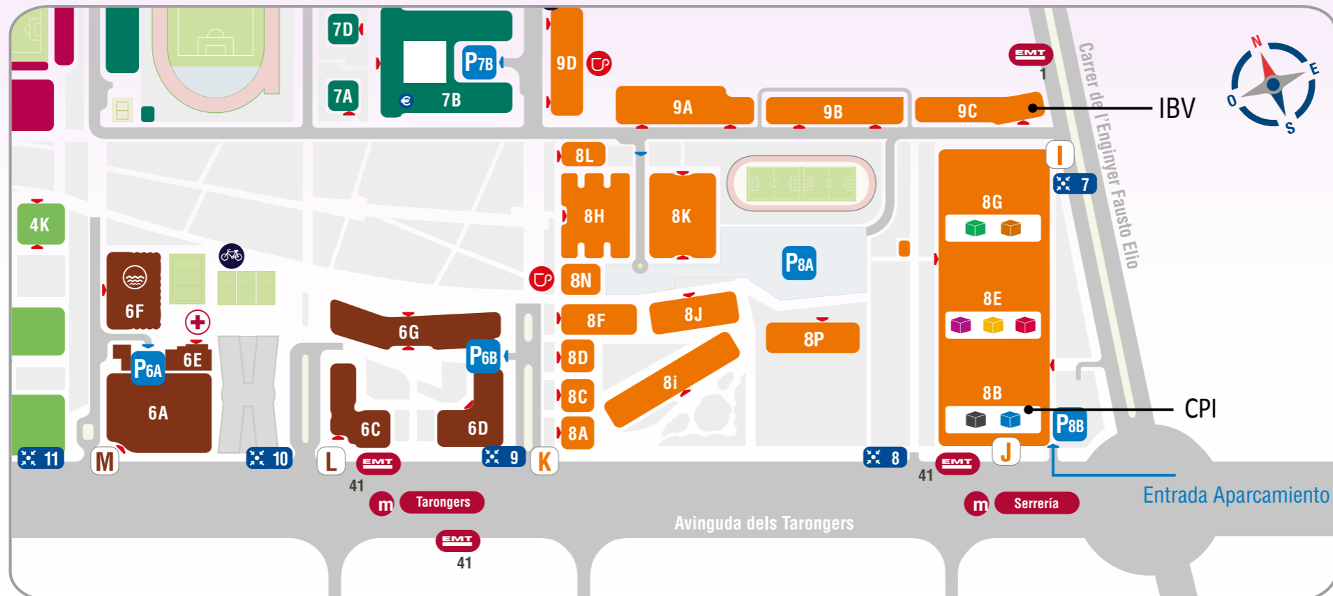
Mapa de localización en la UPV

Lugar de celebración: Universitat Politècnica de València (UPV): Instituto de Biomecánica (IBV), Ciudad Politécnica de la Innovación (CPI).