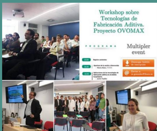
Foto 4. Evento Multiplicador OVOMAX

El Evento Multiplicador (actividad para la difusión de los resultados intelectuales del Proyecto) dentro del Proyecto OVOMAX, se organizó el 07.02.2017, en el Hospital Universitario Virgen del Rocío, en Sevilla (España)