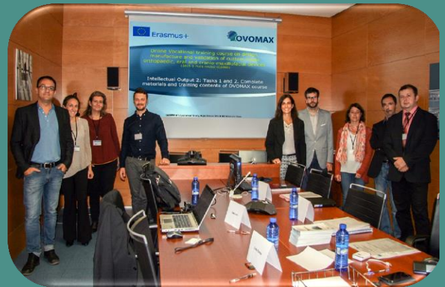
Foto 1. Reunión Anual del Proyecto OVOMAX en el IBV, Valencia, España