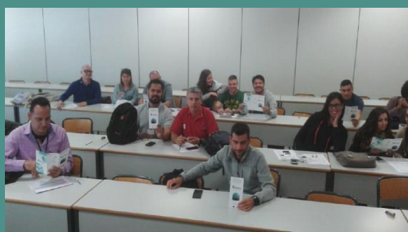
Foto 5. Estudiantes del IBV del Máster de Ensayos Clínicos de Biomecánica