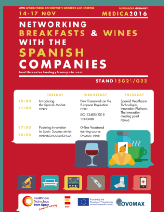
Foto 3. Presentación durante la feria y folleto del evento

4. Workshop en tecnologías de fabricación aditiva: Proyecto OVOMAX.