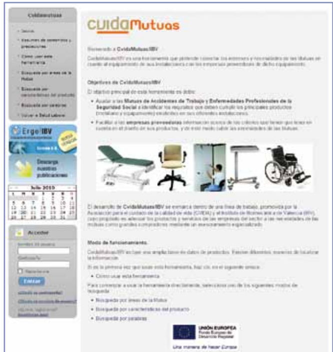
Figura 1. Página de inicio de la aplicación CuidaMutuas/IBV.